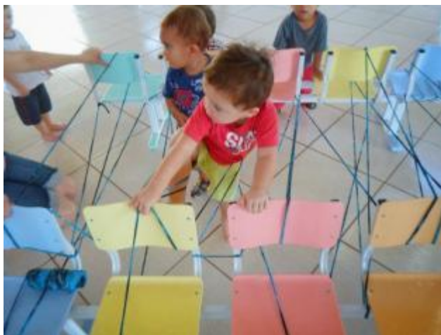
Imagem da atividade.

casa, ela movimenta passando embaixo ou em cima. Boa atividade.